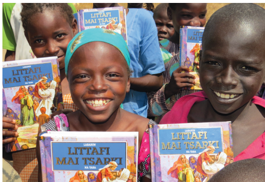
▲ 굶주린 아이에게 엄마가 유니세프가 지원하는 보건 센터에서 긴급 식량을 먹고 있는 모습(좌). 그림 성경을 받고 기뻐하는 난민촌의 나이지리아 아이들.