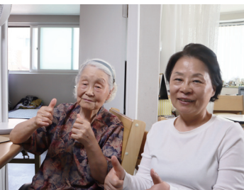
▲ 사랑하는 딸과 함께.

“딸의 기도로 그렇게 됐어요. 내가 그러고 싶어서 된 게 아니에요. 내가 초사흘마다 절에 갔는데, 그때마다 딸이 주의 종을 모셔다가 집에서 기도를 했어요. 그때 내가 평화시장에서 옷 장사를 했는데, 장사가 더 안돼더라구. 사람들에게 물어보니까 재수 부적을 쓰래요. 그래서 절에 가서 돈을 주고 부적을 써가지고 왔어요. 그런데 그날 평화시장에 새끼줄을 쳐놓고 못 들어가게 하는 거예요. 그때 평화시장에 불이 났던 거였어요. 뉴스를 들으려면 그때는 라디오를 들어야 되는데, 안 들었지. 불이 난 줄도 모르고 시장에 갔는데 불이 났다는 거예요. 장사 잘 되게 하려고 부적을 부치러 갔는데... 그 자리에서 부적을 비벼서 찢어 버렸어요. ‘내가 다시는 안 믿는다. 알기는 개뿔 알아. 부적을 부치면 장사가 잘돼? 내가 다시는 안 믿어.’ 그랬지요.”