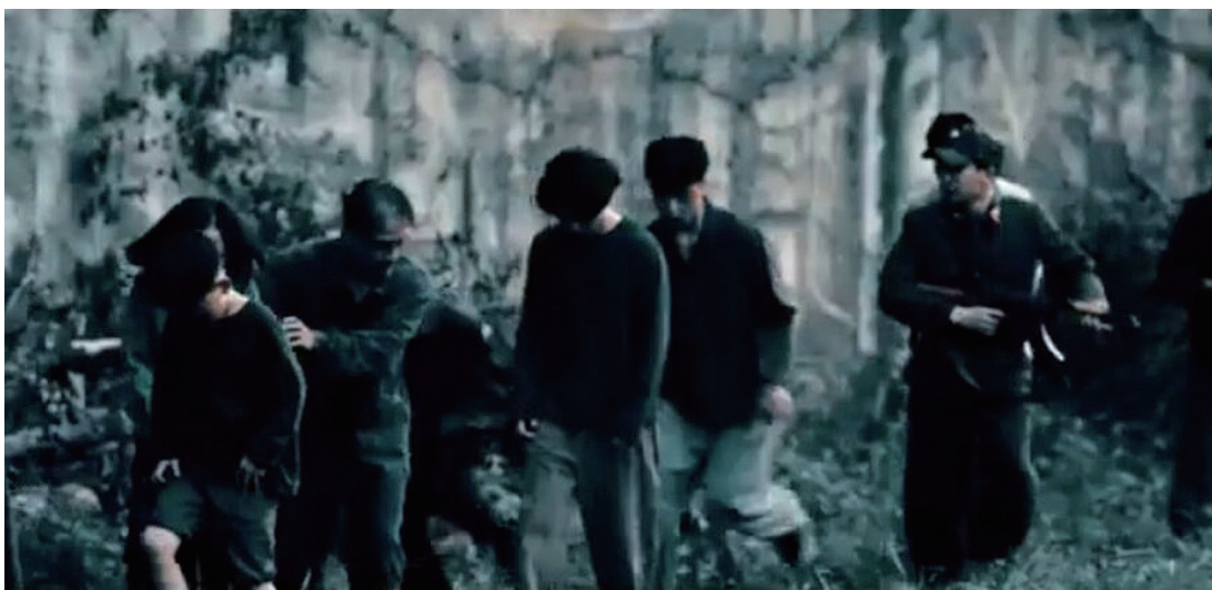
▲ 영화 속에서 북한 지하교인들이 정보기관원에 의해 끌려가는 장면.

최근 북한 평안남도 순천시에서 예배를 드리던 지하교회 교인들이 국가보위부에 체포됐다고 자유아시아방송이 지난 19일 보도했다.