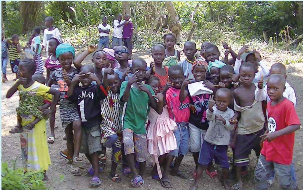
▲ 시에라리온에서 만난 아이들.

카메라 앞에서 다양한 손 동작으로 포즈를 취한 시에라리온 아이들. 한결같이 밝은 표정으로 자신의 존재감을 표현하는 이들을 바라보면 절로 미소가 흘러나온다. 그러나 그 땅에는 인간의 탐욕으로 인해 그렇게 마음을 표현할 수 있었던 손발이 잘려나갔던 아픔의 역사가 있었다. '시에라리온의 별'로 불린 다이아몬드의 값어치가 알려지면서 이를