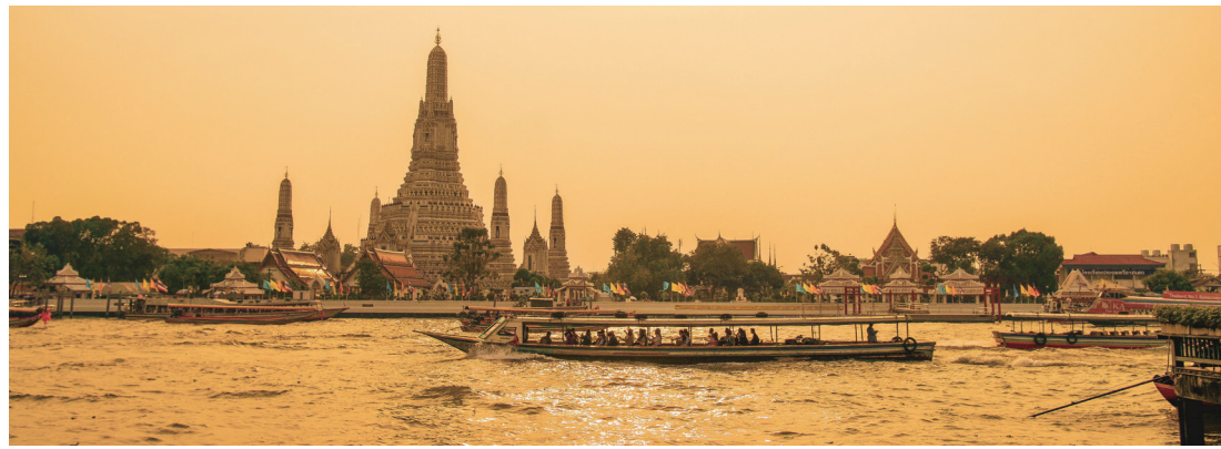
▲ 태국 방콕의 풍경.

로 갈 것이기에 우리에게 미리 마음의 준비를 하라고 한다. 12년 동안 아이들을 가르치고, 그들의 신앙을 위해 수고했는데 딸이 개척할 때 모든 가족을 이끌고 떠나겠다니 청천벽력과 같은 소리로 들렸다. 실망감과 자괴감이 나를 괴롭게 했다.