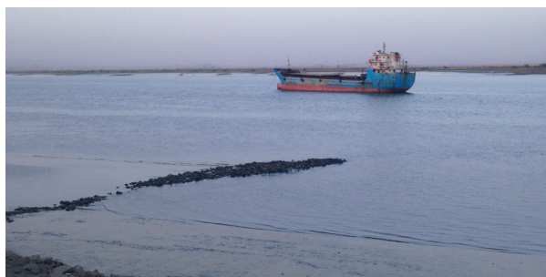
▲ 북중 접경 지역인 중국 랴오닝성 단둥의 압록강.

나고 살길을 찾아라.”고 했고, 아들은 초등학교에 맡겨졌다. 이씨는 형기를 1년도 채 채우지 못한 상황에서 영양실조에 걸려 교화소 안에서 사망했다. [GNPNEWS]