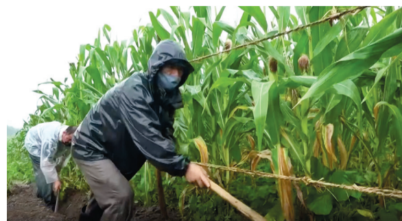
▲ 주민들이 각 지역에서 장마철 홍수 피해를 예방하는데 총력을 기울이고 있다.