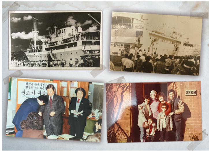
▲ 로고스호 사진(위)과 1985년 선교사 파송배(아래 왼쪽), 영국에서 게스트하우스 주인과 함께(아래 오른쪽).

국에 로고스 배가 들어왔을 때, 통역과 번역, 안내하는 일을 제가 맡으면서 선교에 대한 눈을 뜨게 된 것 같아요. 24~25개국 사람들이 배에서 공동생활을 하고 있었는데, 이들과 한국교회 방문, 학교, 교도소 방문, 거리 전도, 교회 지도자 컨퍼런스 등의 프로그램을 함께 진행하면서 선교가 뭔지 보게 된 것이죠. 그리고 1978년에 영국에서 열리는 오웬 컨퍼런스에 참석하고 60여 명의 팀과 함께 유럽 대륙을 횡단해 이란에서 배를 탔어요. 보통 선교사라고 하면 말씀을 전하는 것만 생각하는데, 배에 타면 8시간은 막노동은 해요. 배는 사실 녹과의 전쟁이더군요. 그래서 페인트칠 하고 청소하고 엔진실에서 땀 흘리고 일하고 나면 ‘내가 왜 이 배를 탔나?’하는 생각도 들죠. 그렇게 노동하고 땀을 흘리는 게 선교사 훈련이었다는 것을 그때는 미처 몰랐어요.”