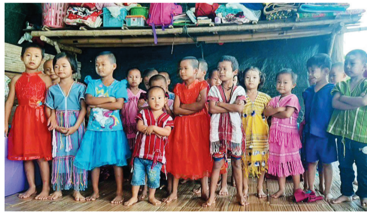
▲ 카렌족 어린이들.

의미가 있는가? 다투 왕에 대한 메시지가 그들에게 어떻게 다가올 것인가? 포탄 소리 가운데 전하는 메시지보다 포탄 소리로 인한 메시지가 훨씬 클 것 같다. 나의 한계를 느끼지만 한편으로 이들에게 이번 방문 자체가 적지 않은 격려가 되었던 것 같다. 연약한 공동체에 잠시나마 함께 한 것에 대한 감사의 자세를 통하여 확인한다.