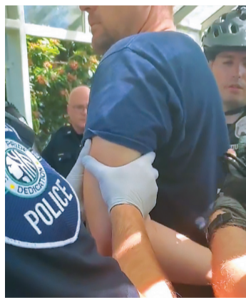
▲ 미국 시애틀 거리에서 성경을 낭독하다 체포된 노방 전도자.