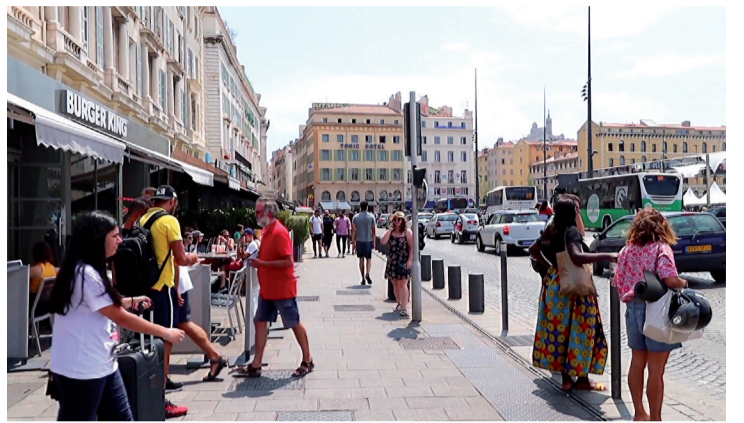
▲ 프랑스 남부 마르세이유의 거리.

북부 아프리카(리비아, 알제리, 튀니지, 모로코, 모리타니아)는 이슬람 창시자인 무함마드가 죽은 이후(AD 632년) 가장 먼저 무슬림화된 국가들이고, 지금은 매우 강한 무슬림 국가들이 되었습니다. 프랑스가 북부 아프리카를 식민지