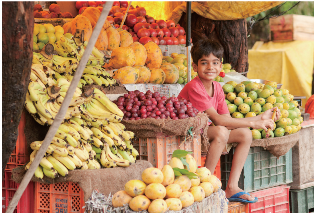
▶ 인도 과일가게에서 만난 어린이