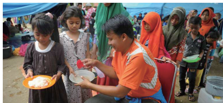
▶ 2016년 아체 지진 당시 아이들에게 음식을 나눠주는 구호활동 봉사자의 모습

2016년 11월에 또 한 번의 큰 지진이 아체에 있었습니다. 그 지진은 아체에서도 제일 강성 무슬림들이 사는 지역에 발생하였습니다.