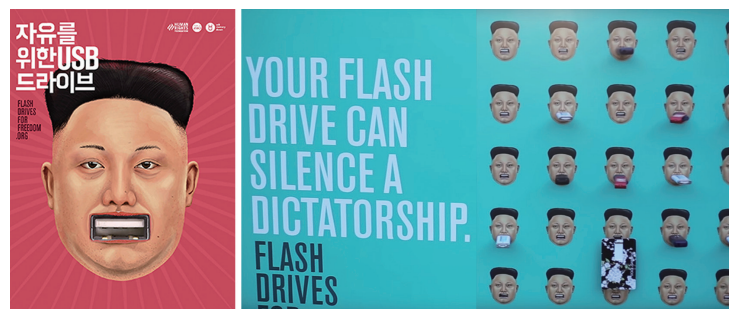
▶ 미국 인권단체 휴먼라이츠파운데이션(HRF)은 북한에 정보를 제공하기 위해 USB를 기부받고 있다. '자유를 위한 USB드라이브, 북한 체제의 세뇌 교육에 맞설 힘을 지닌 USB드라이브'라는 타이틀(왼쪽 포스터)로 세계 각국 주요도시에서 USB를 꽂을 수 있는 간판(오른쪽 사진)이 세워져있다. 시민들은 이런 간판과 우편 혹은 현금 기부로 동참하고 있다

근 늘어나고 있는 학원에서 직접 가르쳐 주기도 한다”면서 “다만 학원에서는 한국 춤이라고는 말하지 않는다. 아이들도 실체를 알고 있지만 그냥 넘어가는 경우가 많다”고 덧붙였다. 그러면서 그는 “영상물은 해외에 흘러들어온 것을 메모리나 유심칩으로 핸드폰에 끼우고 보는 것이 일반적이고, 집에서는 컴퓨터로나 녹화기로 보기도 한다”며 “외국 영상물들은 중국을 통해서 밀수로 들어오는 것이 태반인데, 들어온 영상물을 컴퓨터로 복사해서 유포하기 때문에 많은 사람들이 쉽게 구입해서 볼 수 있다”고 말했다. 당국의 검열이나 단속 시 감추기 쉬운 작은 크기의 장치를 통해 누구나 쉽게 영상물을 구할 수 있다는 것이다. 한때 해외