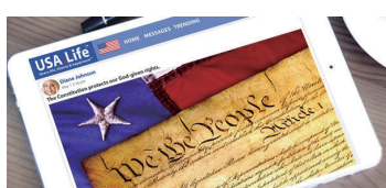
▶ 미국의 새로운 소셜네트워크가 될 USA.Life

美 전문가, 클라우드펀딩 통해 usa.life, 1776free.com 개발