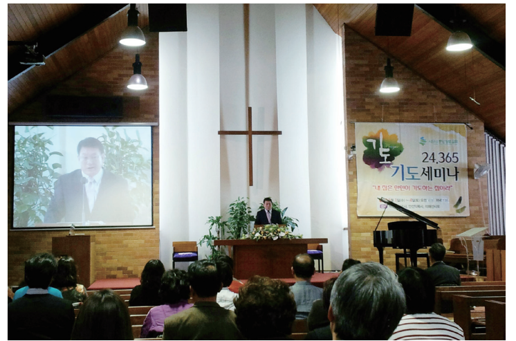
▶ 24시간 기도를 시작한 이후, 중보기도세미나를 통해 전교인이 기도의 불이 꺼지지 않도록 만민이 기도하는 교회가 되어야 한다는 사실을 붙잡게 되었다

교단 열방기도센터(ANPC)에서 진행하는 기도프로그램에 참여하기로 했습니다. 세계기도정보를 가지고 하루에 한 나라씩 성도님들이 연속으로 돌아가면서 기도하는 방법으로 기도사역을 시작한 것입니다. 그때로부터 지금까지 7년이 넘는 시간 동안 하나님께서는 우리 교회를 열방기도센터로 세우시고 기도의 불이 꺼지지 않는 교회로 사명을 감당할 수 있도록 해주셨습니다. 때로는 기도자의 숫자가 채워지지 않아서 기도시간이 빌 때도 있었고, 또 기도하는 분들이 이 기도의 응답과 열매를 보지 못해서 힘을 잃어버리는 시간도 있었습니다. 하지만 이 일이 하나님께서 원하시는 일임을 여러 가지 방법으로 보여주셨습니다. 그리고 기도하는 교회가 될 때 어떻게 하나님께서 교회를 변화시키는지 경험하게 해주셨습니다.