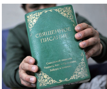
▶ 불법 마약 밀매꾼에서 성경을 읽고 변화된 후, 성경과 전도자료를 성도들에게 물려주는 빅토르형제

카자흐스탄의 키질로르다(Kyzylorda)지역에서는 한 성년 부부가 가정교회 목사를 찾아와 부모의 허락 없이 아이들을 예배에 참석시키는 것은 금지되어 있다고 항의하며 경찰에 신고했다. 경찰은 교회를 수색하고 촬영하는 한편 모든 성도에게 교회에 출석하는 이유를 설명하는 진술서를 쓰게 했다. 경찰은 억지로 가정교회에 나오는 것은 아닌지, 혹은 어떤