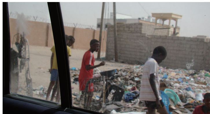
▶ 주님이 이곳보다 더 더러운 내게 오셨다는 사실을 깨닫고 선교사의 부르심을 확증하게 된 M국의 쓰레기 더미 근처.